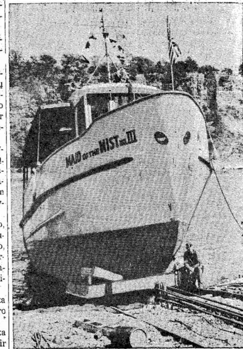
Maid of the Mist No. III. Tai naujas laivas, kuris vežios žmones prie Niagaros vandenpuolio. Čia jis matomas nuleidžiant į vandenį. Anksčiau plaukiojusieji sudegė.