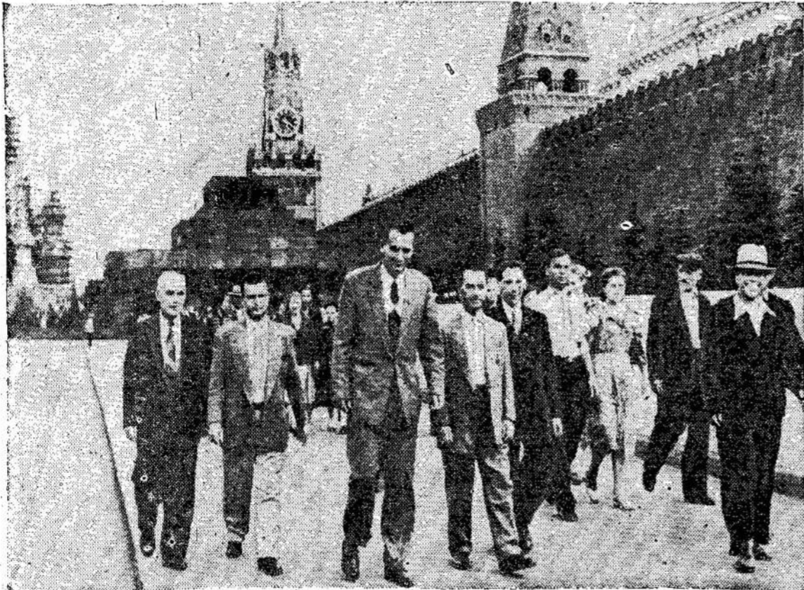
Kanados slaviškų laikraščių Redakcijų nariai Maskvoje, Raudonojoje aikštėje. Dele-gacija važinėja po Tarybų Są-jungą, kaip ir kitos kanadie-čių delegacijos.