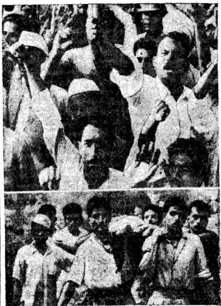
Indijos nacionalistai surengė demonstraciją į portugalių valdomą Goa sritį. Jie ėjo nuogomis rankomis. Bet Portugalų policija pasitiko kulkomis ir 22 iš jų užmušė. Viršų matote demonstrantus laike jų žygiavimo, o apačioje — nešančius užmuštuosius.

Bet kur didesni "satelitai", žmonių pavergimas: Ar gytinės Europos valstybės, kurių žmonės pasiliausuoda-