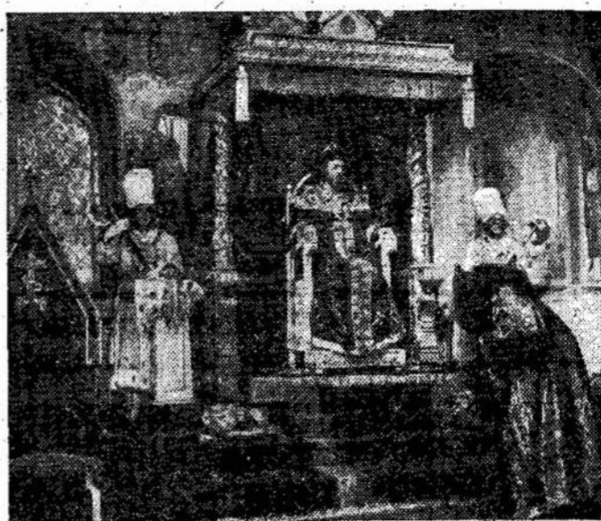
Caro karūnacija — istorinis momentas iš operos "Boris Godunovas", kuri bus rodoma Eaton Auditorijoje spalio 26 dieną, tiktai vieną dieną.