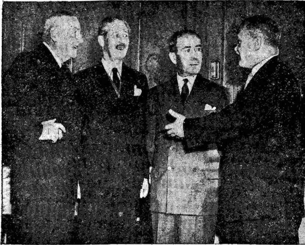
Keturių didžiųjų užsienio reikalų ministrų, F. J. Dulles, Harold Macmillan, Antoine Pinay ir V. M. Molotov, kurie čia matomi laike diskusijų New Yorke. Ši mėnsį jie pradės pasitarimą Ženevoje pagal anksčiau įvykusios konfer. nutarimą.