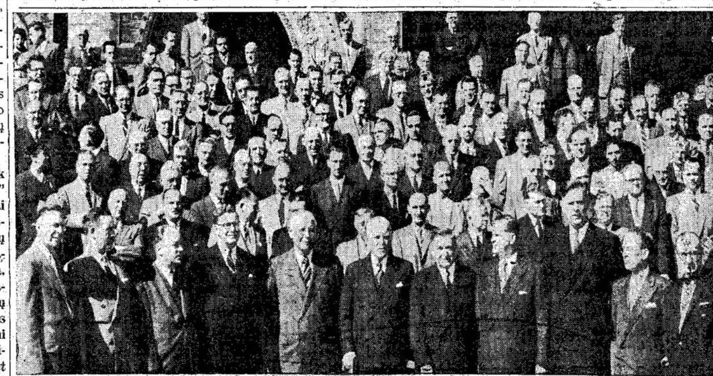
Dešimties provincijų premjerai su federalės valdžios patarėjais, kurie svarstė Otawoje finansinius ir kitus santykius tarp provincijų ir federalės valdžios. Iš spaudos pranešimų atrodo, kad pasitarimas neina sklandžiai. Manoma, kad derybos bus pertrauktos.

"Jei tikrai taip būtų, tai, regis, turėjo jau sugriūti. Bet, štai, Lietuva jau išsisas dešimtmetis tebėra tose pačiose replėse ir nematyti, kad jos rengtūsi nulūžti. O pati sovietinė valstybė "griūva" jau beveik 40 metų, ir vis niekaip nesugriūvo. Priešingai, net galingieji bijo netik jos pastūmėti, kad greičiau griūtų, bet vengia net paliesti. Vadinasi, tuose nesisekimų ir griuvimo vaizdavimuose yra kažkas netvarkoj. Matyti, tas vaizdavimas, kad sovietinėj valstybėj viešpatauja ant 12 puslų.)