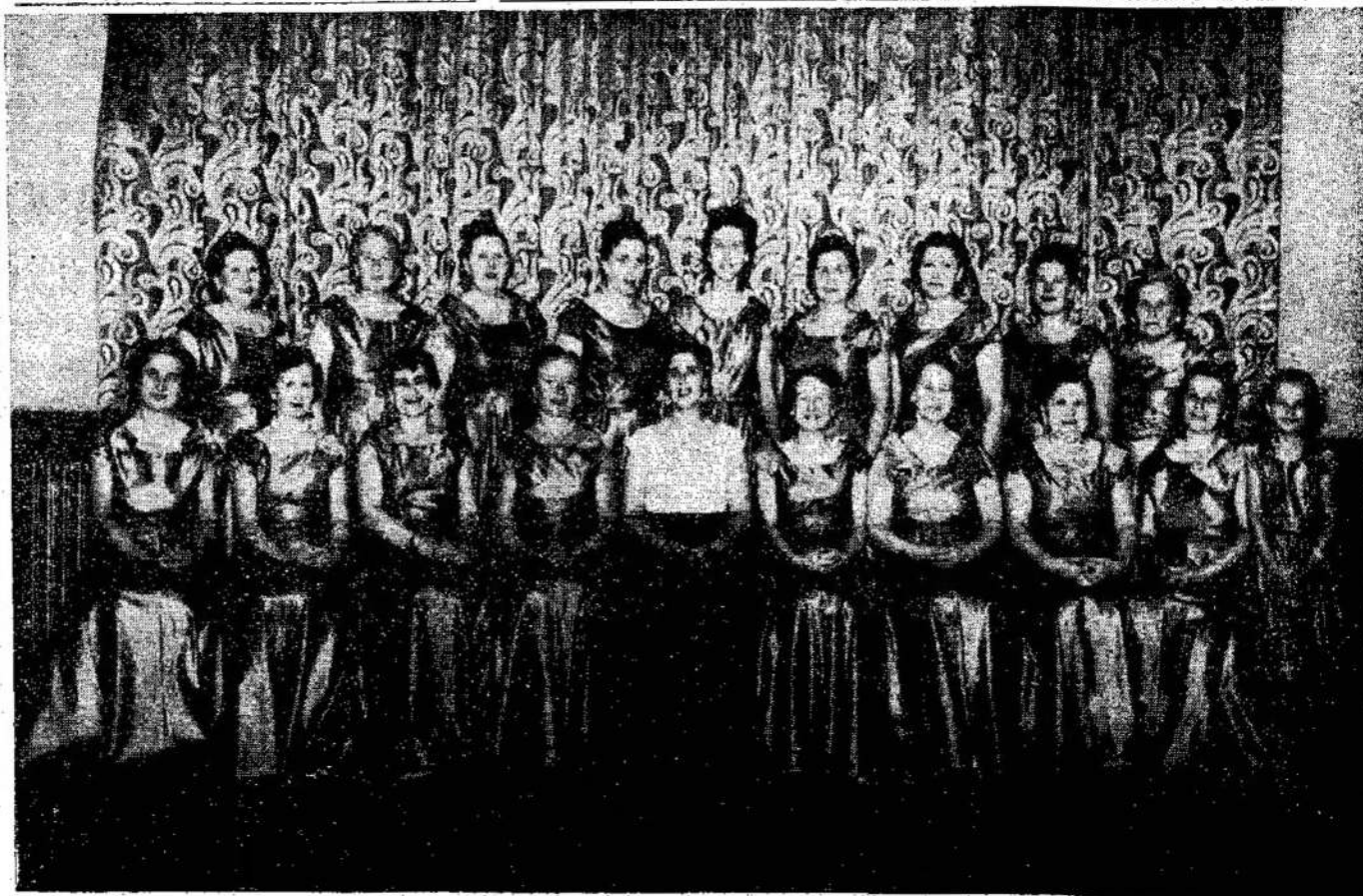
Toronto lietuvių moterų choras vyrų. Jis dainuos Christie St. Galima pridėti, kad šis choras yra senesnis ir už Liaudies Balsą, nors

jame labai mažai narių, kurie sudarė jį 25 metai atgal.