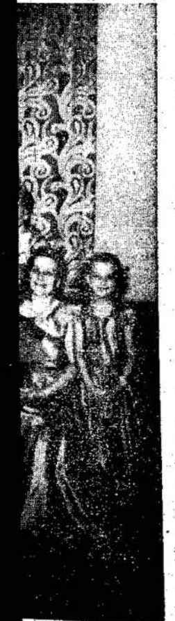
Mažai narių, kurie ji 25 metai at-