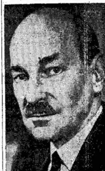
Clement Attlee, išbuves Darbo Partijos lyderiu virš 20 metų, bet šiomis dienomis pasitraukęs. Karalienė padarė jį grafu, ko pasekoje jis automatiškai pereina į lordų rūmus, kur jis bus darbiečių lordų lyderiu.