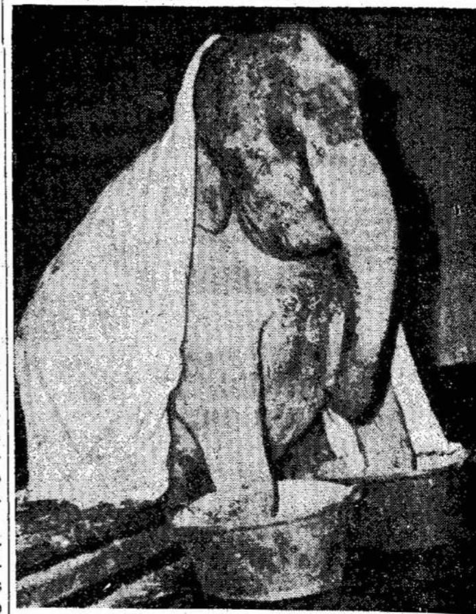
Kada dramblys suseraga šalių nosyje, tai ne visai mažas dalykas. Štai "Kamaikhsis" iš Londono cirko gydosis šaltį — kaitina kojas muštardos vonioje.