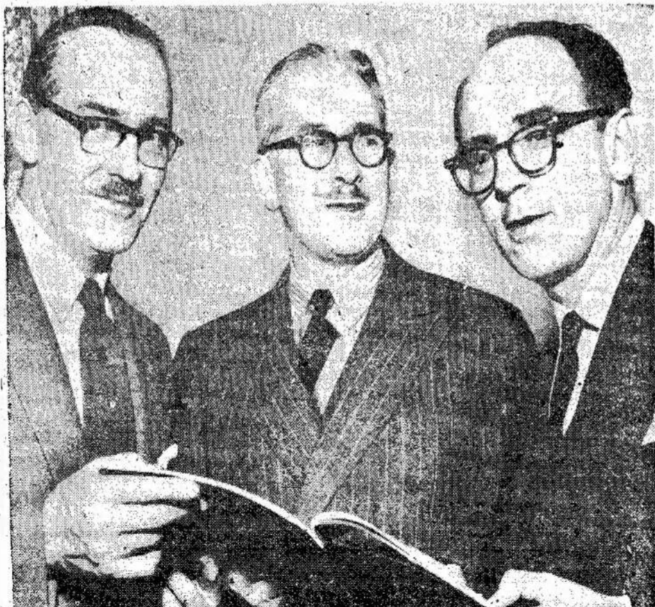
Karališkosios komisijos nariai, Dr. Andrew Stewart, Walter L. Gordon ir Albert

LLD Kanados Veikiantis Komitetas, P. O. Sta. C. Box 1007, Toronto 3, Ont.