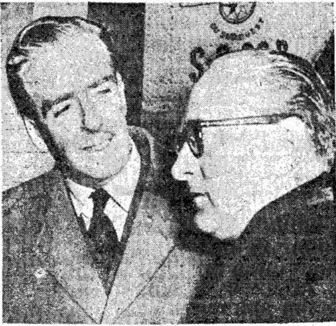
Britanijos premjeras Ede-nas ir Francijos premjeras Mollet, kurie tarėsi, kaip su-

Gal bus nelengva, gal bus ir nemalonumų. Tai di-