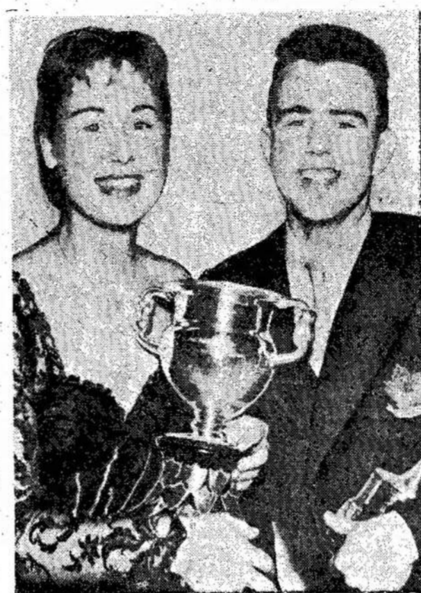
Kanados čiuožimo meistrai, mėjo čempionatus. Pachi yra montrealietė, o Snelling — torontietis.

"Ne dėl to, kad jie mylėtų Staliną, bet dėl to, kad jie žino, kad dabar įkurta kolektyvė vadovybė Tarybų Sąjungoj, ir kad tas reiškia, jog bus tvirtesnė komunistų partija, tvirtesnė Tarybų Sąjunga, ir kad 20-to kongreso