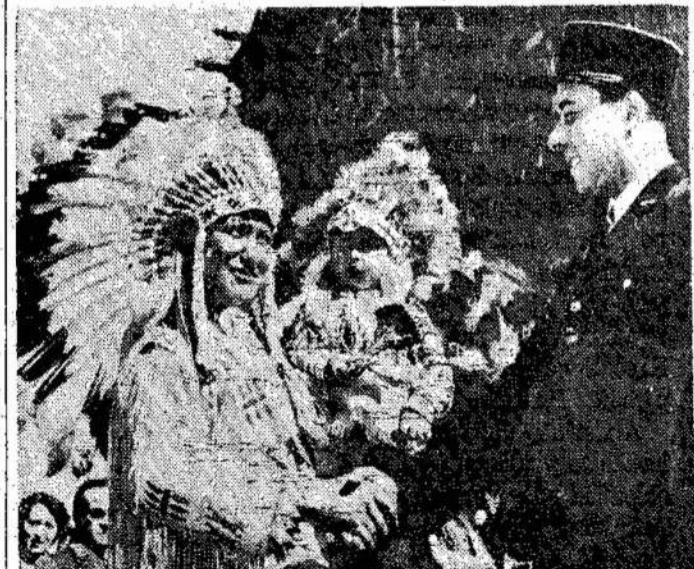
Kanados indijonai lankosi kant svečius iš Kanados. Su Paryžiuje. Čia matote Paryžiaus policininką pasitin-

Aukščiausias teismas sako, kad valtiniai "sedition" įstatymai yra nelegalūs.