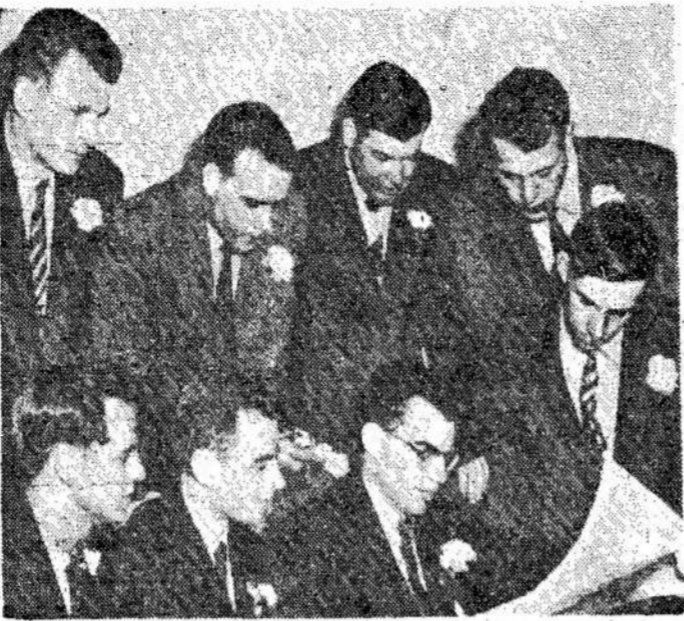
Kanados nauji daržininkai, užims vietas įvairiose Kana- doje, kaip sodininkai ir daržininkai.

O priešai, kaip pamenate, stengėsi vis išbrauti į sau- gumo vadovybę, iš kur būtų