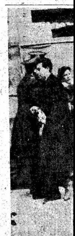
Atėnų policija gaud tus, protestuojanč Britaniją, kuri ištr

Darbininkų klases tjetijos sąjunga, b TSRS tautų draugyb lėstanti liaudies n cialistinei Tėvynai, lima visos tarybinės