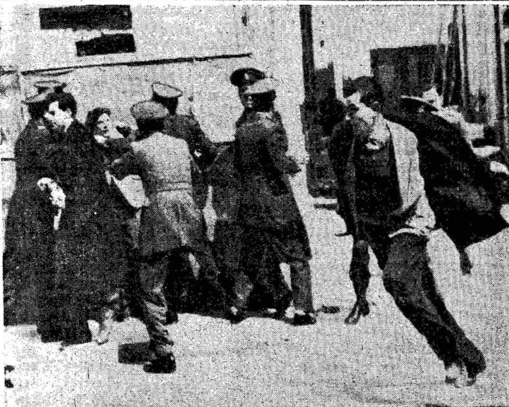
Atėnų policija gauda studentus, protestuojančius prieš Britaniją, kuri ištrėmė Kip-

„Šiame reikale, imigracijos departamentas imasi (Pabaiga ant 9 pusl.)