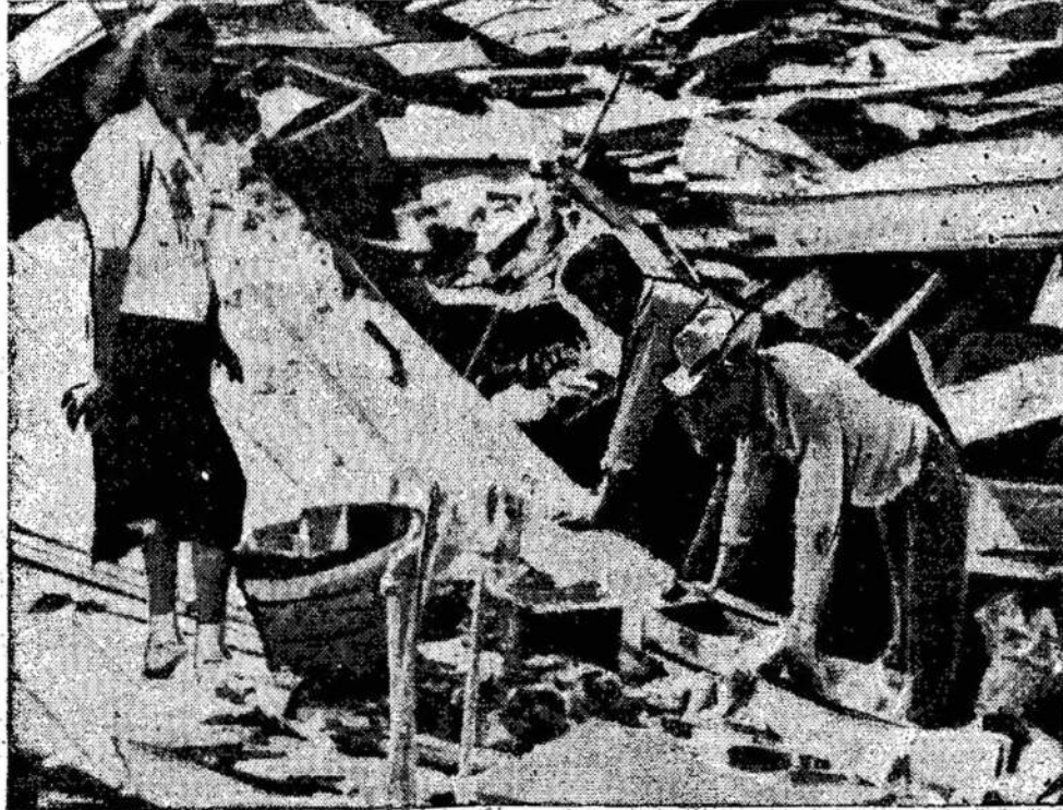
Scena Miami, Oklahomoje, po to, kai praėjo 89 mylių į va- landą viesulas. Keliose vals- tijose 50 asmenų žuvo ir 1- 000 buvo sužeista. Tas piet- nėse valstijose dažnai būna.