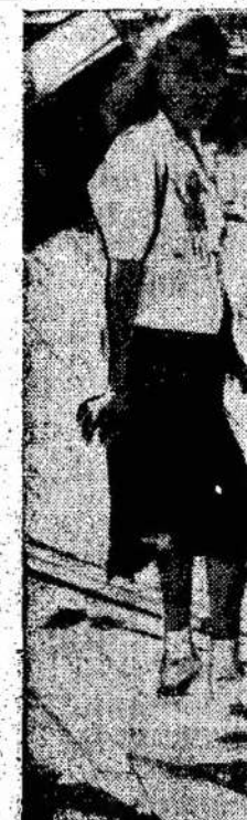
Scena Miami, Oklahoto, kai praėjo 89 my