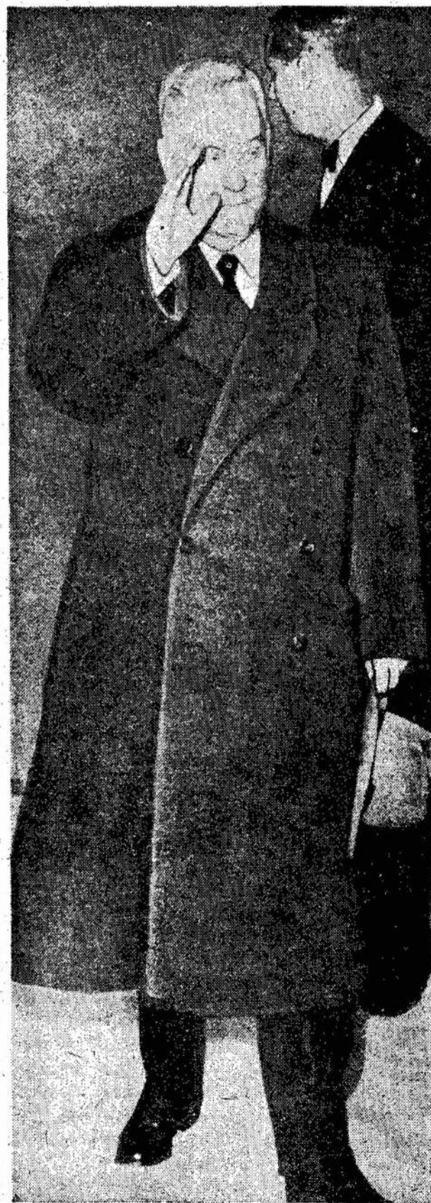
Tarybų Sąjungos premjeras Nikolaj Bulganin sveikina Chruščiovas praleido Anglijoje 10 dienų. Apie jų vizito rezultatus jau žinote iš spaudos.

Ne tam, kad įbauginti kairiosios. Mes visuomet stovėjome ir tebestovime už sumąžinimą apsiginklavimo ir už uždraudimą atominių ir hidrogeno ginklų. Mes pasiūlėm konstruktyvius pasiūlymus šiuo reikalu. Jei aš kalbu apie tai dabar, tai tik dėl to, kad priminti jums, kad suvaržymai prekyboj su mumis nesulaukė mūsų ir negali sulaukyti vystant technologiją. Kokia iš to išvada? Prekyba yra reikalinga. Tik tai vystymas plačios prekybos gali išlyginti esančius nereguliarumus santykiuose tarp mūsų šalių.