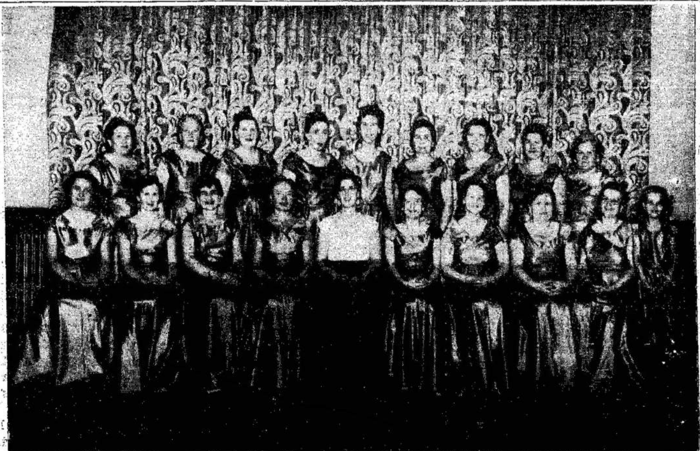
Toronto Lietuvių Moterų Klubo choras, kuris dainuos Sūnų ir Dukterų Draugijos gegužės 12 dieną. Šiame pirmos kuopos parengime rengime šokiams gros geras orkestras. Bus ir gėrimų ir užkandžių.

Šių traukinių vagonai dviaukščiai. Kiekvienas traukinys turi po 4 vagonus. Taigi, į keturius vagonus sutelpa tiek keleivių, kiek į 8 paprastus.