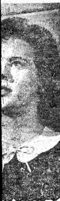
adieux, 16 metų ontrealietė, nauja radio ir televizijos. Nei viena daini-greitai neiškilo,