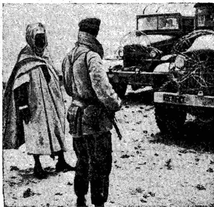
Francūzai sutraukė į Alžirą prieš vietinius, norinčius nešimtus tūkstančių kariuomenės ir veda atkaklų karą patrulį sulaukijusį arabą