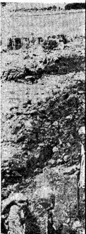
Egiptiečiai dirba prie Suez kanalo pagerinimo. Yra samas dviejų mylių kanalo siauriniame gale. Kad bus užbaigtas, laivų ju-

Baigdamas savo kalbą, sakau jums: Draugai, ačiū! Merdeka! Merdeka! Merde-ka!