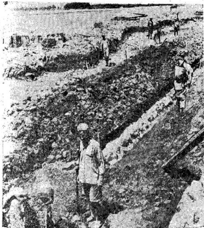
Egiptiečiai dirba prie Suezio kanalo pagerinimo. Yra kasamas dviejų mylių kanalas 4 valandom trumpiau. Darbiai bus užbaigti dar šiais metais.

sime siela su jumis, dvojame už vieno- as, nes mes ir jūs isvė. Ir mes, ir jūs aika. Kas gali būti uz tai? Kai indone- sitinka vienas su sveikina vienas ki- s: "Merdeka", kas aisvė". mas savo kalbą, sa- s: Draugai, ačiū! Merdeka! Merde-