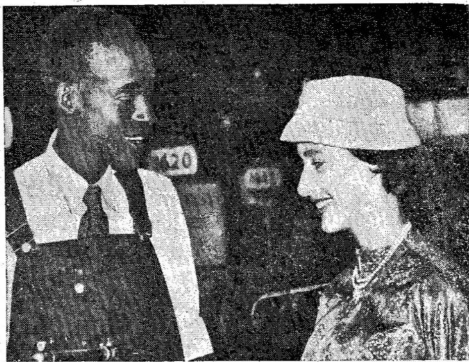
Princesė Margareta kalbasi su Kenjoj. Baltieji valdonai ku negru gelžkelio darbinin- buvę labai nepatenkinti jos pasirodymu su negrais. Esą, ji uždavus smūgi jiems.

ar yra bent keletas LB skai- tytojų, tai labai prašome pa- sitarę suruošti kokį nors pa- rengimėj ar baliuką, dėl Liaudies Balso paramos. Šio vaju uždaviniai dideli ir jų išpildymas net su kaupu yra būtinas dėl savitraščio išsi- laikymo, tad pakartotinai prašome išnaudoti kiekvieną pasitaikiusią progelę dėl Liaudies Balso išlaikymo ir stiprinimo.