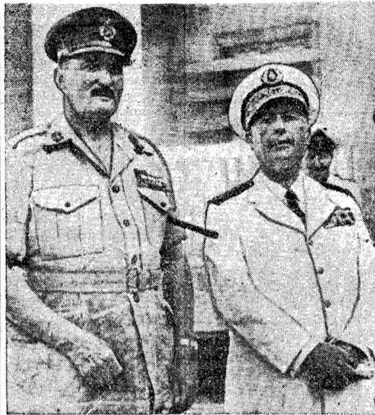
Generolas Charles Keightly (Britanijos) ir admirasolas Pierre Barjot (Francijos), kurie vadovavo britų ir francūzų jėgoms, kurios puolė Egiptą.

Tarptautiniai susikirtimai, vidujiniai maištai ir revoliucijos veda prie taikos ir laisvių sužlugdymo ir ten, kur jos dar veikia.