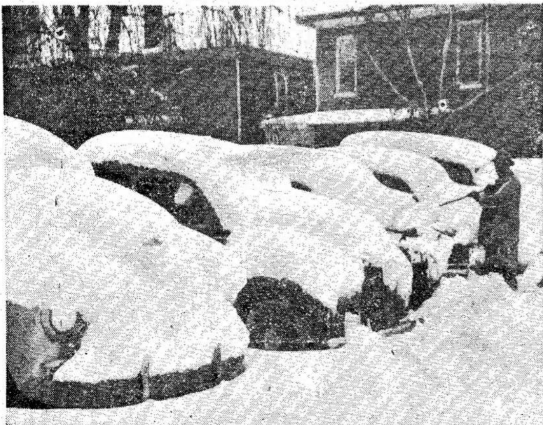
Tuo tarpu, kai Torontė li Toronto, Pictone, prisnigo smarkiai lijo, tai visai neto-Štai vaizdas Pictone. Automobilai užversti sniegu.

Kanados darbo žmonės (Pabaiga ant 12 pusl.)