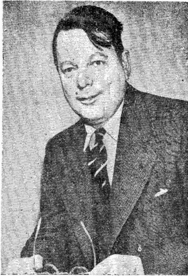
Imigracijos ministras Pick-ersgill, kuris aną dieną Vienoje, Austrijoje, pareiškė, kad vengrai pabėgėliai jam labai patiko. Jie esą jauni, sveiki ir nori dirbti, o Kanadoje tokių kaip tik ir reikia. Ypač ant farmų.