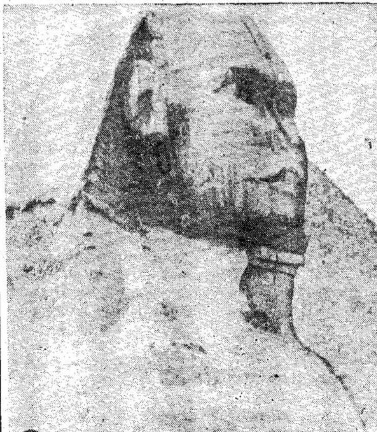
Egiptas yra garsiausias sa- fo sfinksais ir piramidėmis, pastatytomis senovėje dėl mirusiųjų. Čia matote viena iš tų milžinų, senovės egip- tiečių religinių pėdsakų.

Dabar jau nebegalima atnašauti aukas paprastu būdu, padedant prie lavono. Prasidėjo deginimas aukų, maldos į dievus dvasias. Apie tai labai gerai pasakoją senasis šventraštis.