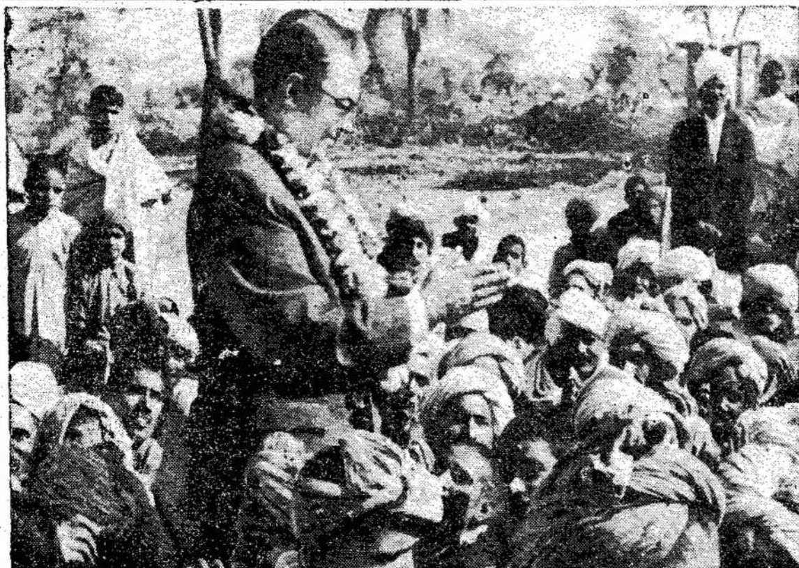
Kanados sveikatos ministras Paul Martin kalba Indijoje. Jis lankėsi eilėj šalių ir sura-

do, kad Vakarai nesupranta Azijos šalių. Girdi, jeigu Vakarai nepakeis atsinešimo,