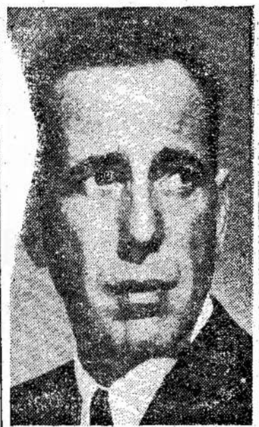
Humphrey Bogart, vienas iš Hollywoodo išgarsėjusių artistų, kurs praėjusią savaitę mirė nuo vėžio, sulaukęs 56 metų amžiaus. Jis vaidindavo "tough guy" roles.

HAVANA. — Oriente provincijoje kariuomenės susirėmimo su sukilėliais užmušti du kareiviai ir 8 sukilėliai.