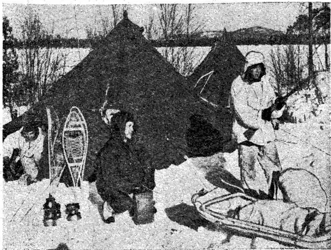
Kanados kariams, kurie stovė šiaurėje, žiema yra ne pikenikas, ypač manevrų metu. Jie čia matomi per manevrus apie palapinę, kurioje turi miegoti didžiausiame šalty.