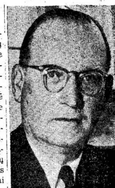
Leitenantas generolas Hans Speidel, kuris vadovavo Hitlerio armijoms kare prieš sąjungininkus, neseniai buvo numatytas NATO jėgų Europoje komandierium.