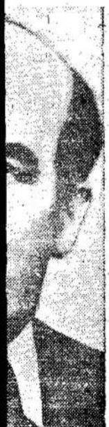
Lenkija, Lenkijos partijos pir... Per pra... seimą jis... aimėjimus.