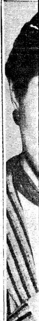
Kiniečiai po v seniaj šventė

Prieš ketvi sziūrėjes į tinės Kauno venimā, juok pretenduodan parašiau "Di nustebau ir prieš keletą tos pačios po tarybinių st "Jaunimo Gr tas mane priv mastyti ir p mintimis.