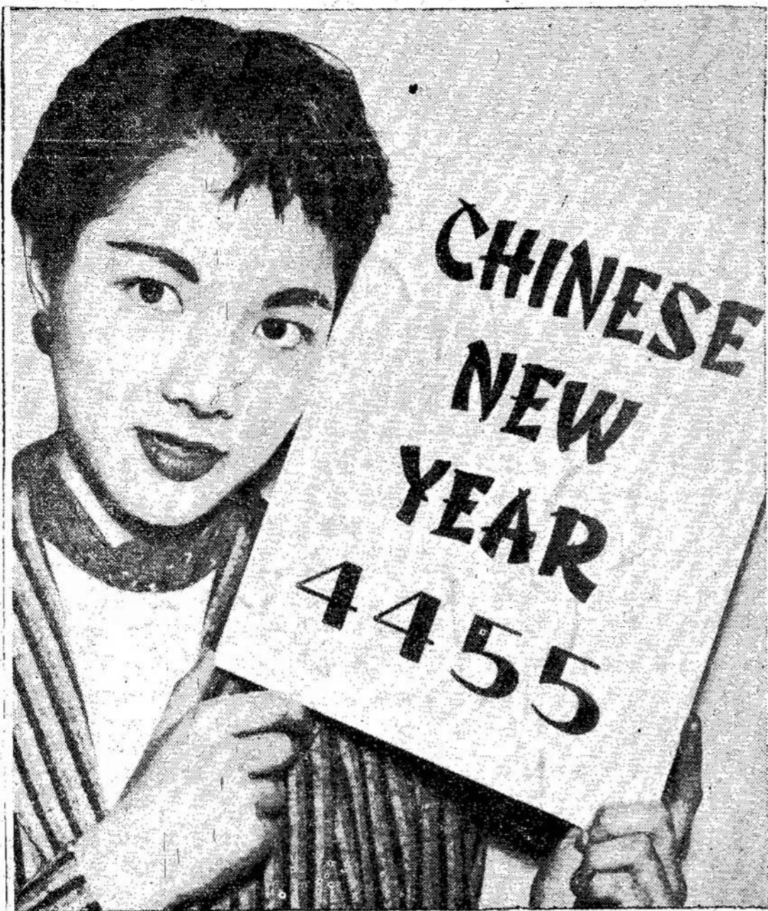
Kiniečiai po visą pasaulį ne- Bet jie šventė ne 1957 me- te vieną iš Toronto kiniečių seniai šventė naujus metus. tus, o 4455 metus. Čia mato- su plakatu.