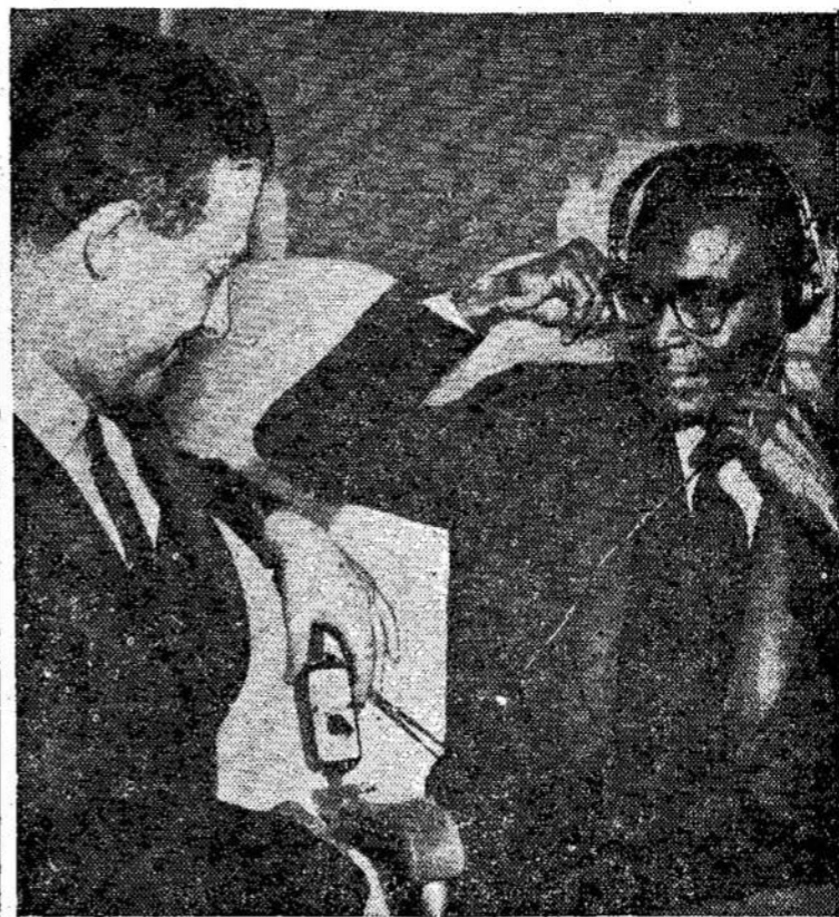
Ghanos atstovas Jungtinėse Tautose klausosi kalbų. Gha- na buvo priimta į JT tuoj po to, kai ji pasiskelbė nepri- klausoma. Ji yra 81-ma JT narė.

Tokią tai padėtį rado ta- rybinė valdžia. O ją karas