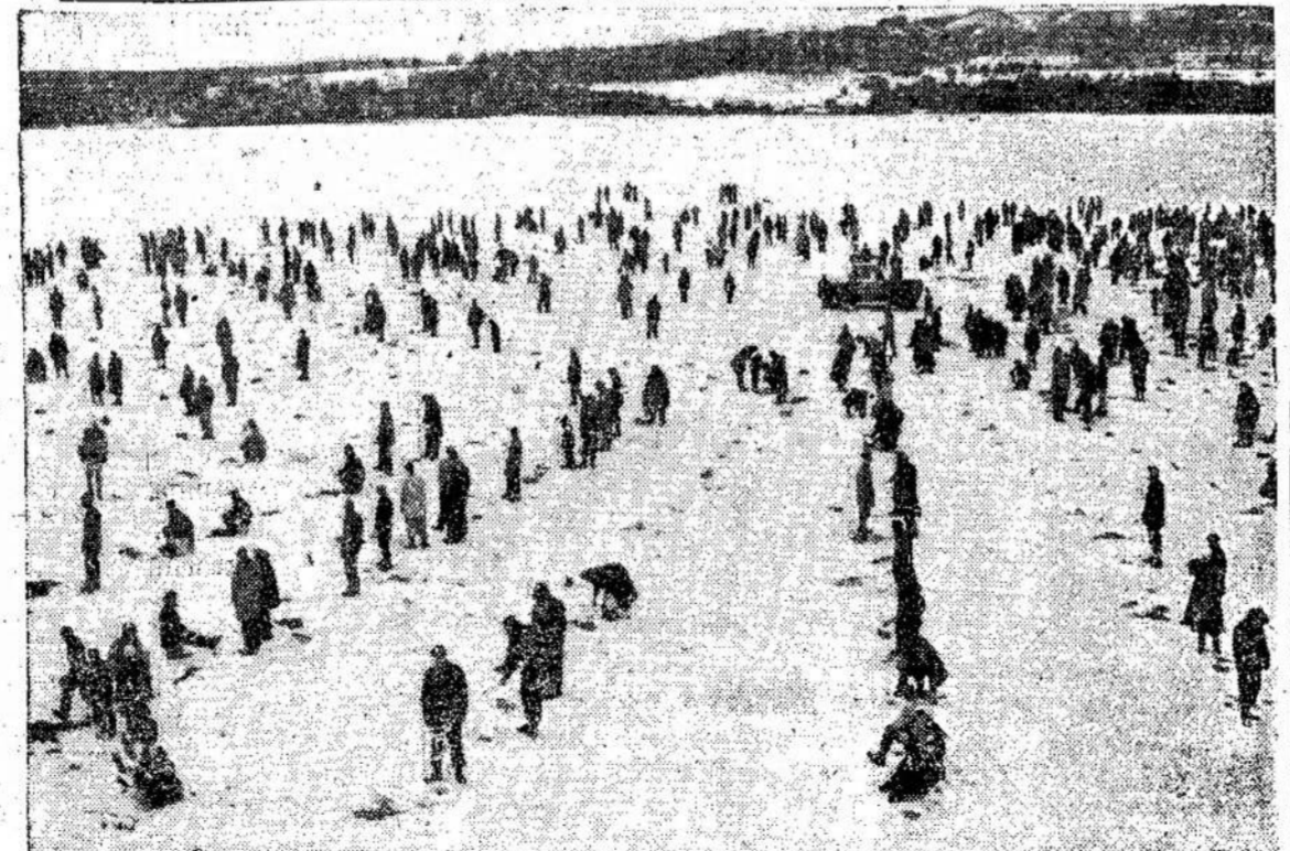
Penetanguishene, prie Georgian Bay, neseniai įvyko festivalis, kuriame žymiausiu įvykiu buvo žuvavimas. Da-

Motina: Aš suradau, kad pačios geriausios vaikų programos turi per daug žiaurumo. Per daug žudynių ir visokių formų sensacijos skverbiasi iš televizijos ir nuodija mūsų vaikų protą ir daro juos beveik neprieinamais geroms knygoms ir muzikai. (Pabaiga ant 6 pusl.)