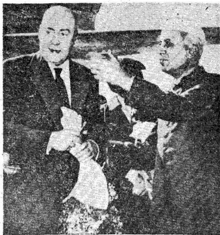
Lenkijos premjeras Josef Cyrankiewicz lankėsi Indijoje ir buvo labai gražiai priimtas su Indijos premjeru Jawaharlal Nehru.

Rinkimai į bendruomenės tarybą parodė, kad tarybininkų mažai kas bepaiso. Vos 8 procentai tebeįsavo.