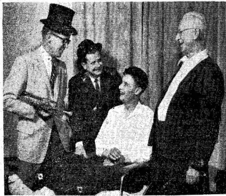
"Happy Gang" artistai lanko Sunnybrooke ligoninės įnamius, praėjusių karų veteranus, kurie dar vis gydo-