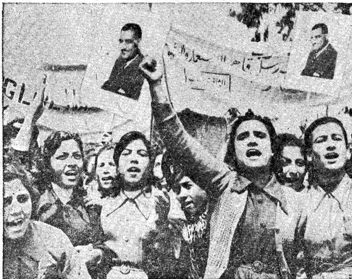
Gaza juostos jaunimas demonstruoja sveikindamas prezidentą Nasserą. Jie šaukė: "Nasser, pergalėtojas!" Ir ištikro, nors Egiptas nukentėjo materialiai, bet jis laimėjo moraliai. Visas pasaulis pasmerkė agresorius ir jie savo prisistatė.