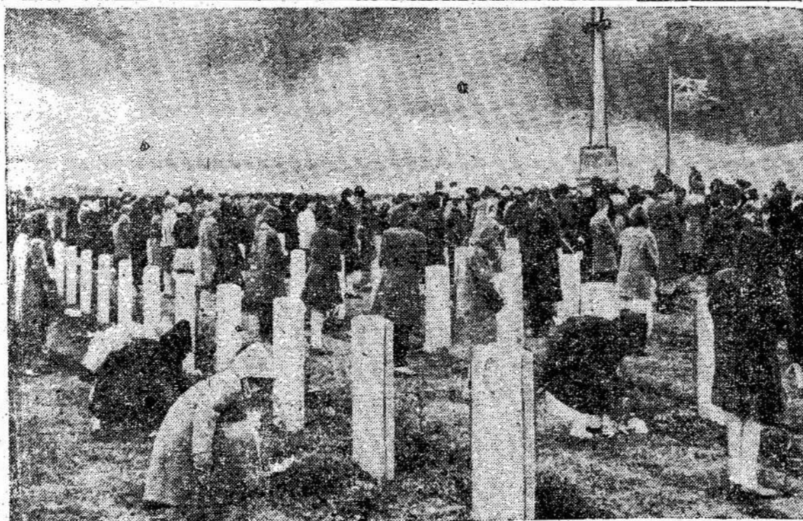
Olandų vaikai puošia kanadiečių kapus Groesbecke, Olandijoje, kur palaidota 2,500 kanadiečių, žuvusių laike antrojo pasaulinio karo. Kiekvieną kapą prižiūri atkiras mokinys. Olandai nemiršta kanadiečių išlaisvintojų iš nacizmo.

MASKVA. — Čia atvyko misija iš Mongolijos. Jai vadovauja premjeras Cedenbalas.