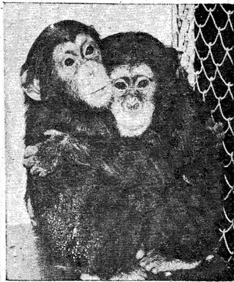
"Aš myliu, aš myliu, aš myliu", kaip atrodo, nėra žmogaus išmisas. Šios dvi beždžionės Granby (Kvebeke) žvėrinčiuje demonstruoja savo "aš myliu".

Jis nurodo, kad senstantieji žmonės labai prastai miega, dažnai kenčia nuo taip vadinamos insomnios. Tas, kartu su kitais nepalankiais faktoriais, duoda nepageidaujamas fizines pasekmes.