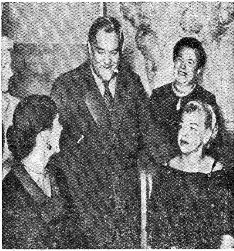
Tarybų Sąjungos premjeras Nikolai Bulganin kalbasi su grupė amerikiečių moterų Maskvoje. Grupėj buvo 18 moterų. Bulganinas kreipėsi į jas, kad veiktų už taiką.