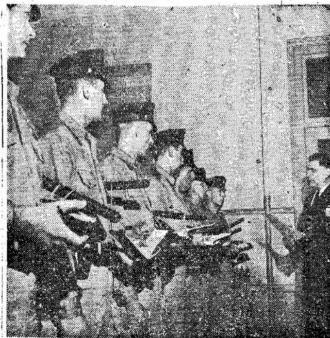
New Yorke pasireiškė jaunų žmogžudžių ir plėšikų gaujos. Siemet jie nužudė jau 22 asmenis. Policija i-

JAKARTA. — Indonezijos valdžia pakvietė Jakartone visus aukštus karininkus, kurie Celebese, Sumatroje ir kitose srityse vadovauja taip vadinamoms sukilėlių valdžioms. Valdžia nori su jais konferuoti ir bandyti atsteigti krašte viešnybę.