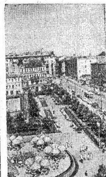
Admiroliteto fasada Leningrade. Mūsų delegacija, kada lankysis Leningrade, greičiausiai atsilankys ir čia.