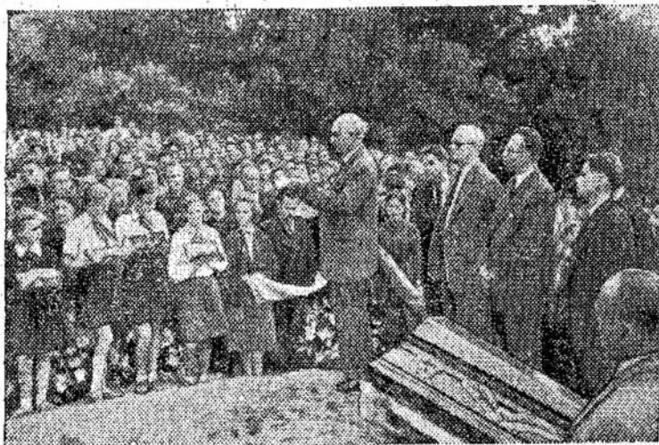
Gedulo mitingas prie A. Žukausko-Vienulio kapo. Kalba Lietuvos TSR Aukščiausiosios Tarytos Prezidiumo pirmininkas J. Paleckis.

universiteto studentai, kurie atlieka čia praktiką, reikalingą diplominiam darbui ruošti.