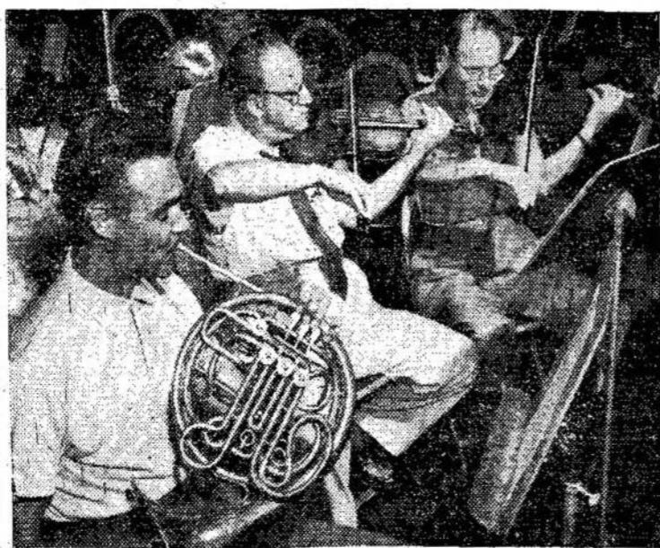
CBC simfonijos orkestras, kuris šią vasarą davė koncertus Stratforde. Sakoma, kad geriausias orkestras

šiam kontinente. Publika galėjo jį matyti tik Stratforde. Jis groja ant radio viena syki į savaitę.