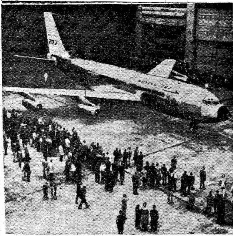
Boeing 707, amerikiečių reaktivinis (jet) keleivinis orlaivis. Tai pirmas amerikiečių tokios rūšies orlaivis. Jis gali nešti 150 keleivių. Čia jis matomas prie fabriko Rentone, Wash. Darbininkai žiūri kaip išeina iš hangaro.