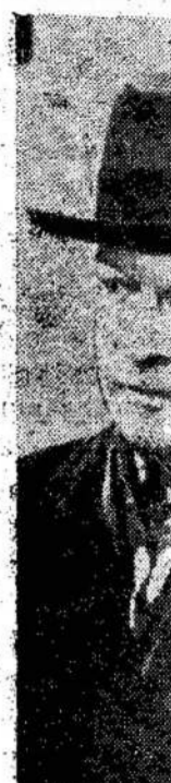
Prezidentas Francijos p Jie susitiko howeris pri NATO kor