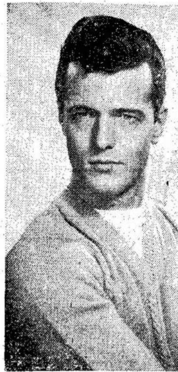
Robert Goulet, Kanados radio ir televizijos dainininkas ir artistas.

Sako, kad tai pirmu kartu toks orlaivis taip aukštai pakilo.