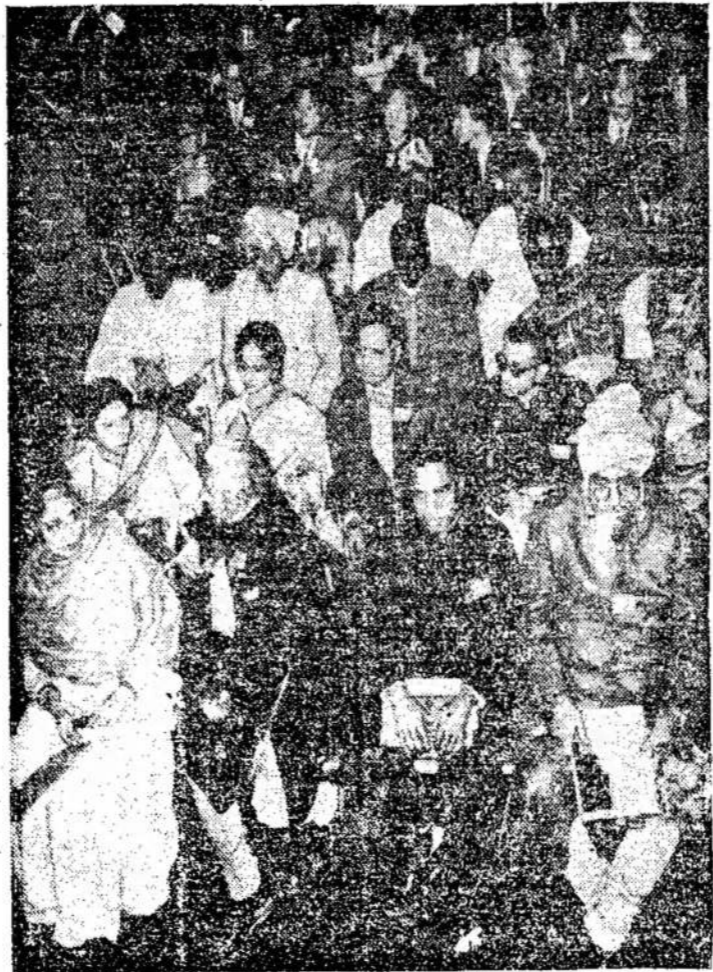
Neseniai Kairo mieste, Egipte, įvyko Azijos ir Afrikos šalių atstovų konferencija, kurioje dalyvavo virš 400 atstovų iš 42 šalių. Ši konferencija parodė, kad abiejų kontinentų tautos ryžtasi kovoti už visišką išsilaisvinimą iš imperialistų jungo.

Bet anksčiau ar vėliau, tačiau reiks susitaikyti ir