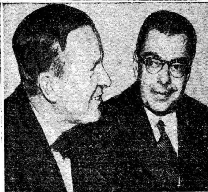
Lester B. Pearsonas, naujas liberalų nacionalis lyderis, ir Paul Martin, kuris taipgi norėjo būti išrinktu. Pearsonas gavo 1,074 balsus, o Martin 305. Prie St. Laurent valdžios Pearsonas buvo užsienio reikalų ministru.

Taika niekad nesirėmė ir nesirems ant kontrolių ir inspekcijų. Juk buvo Tautų Lyga, kuri buvo sukurta iš (Pabaiga ant 12 pusl.)