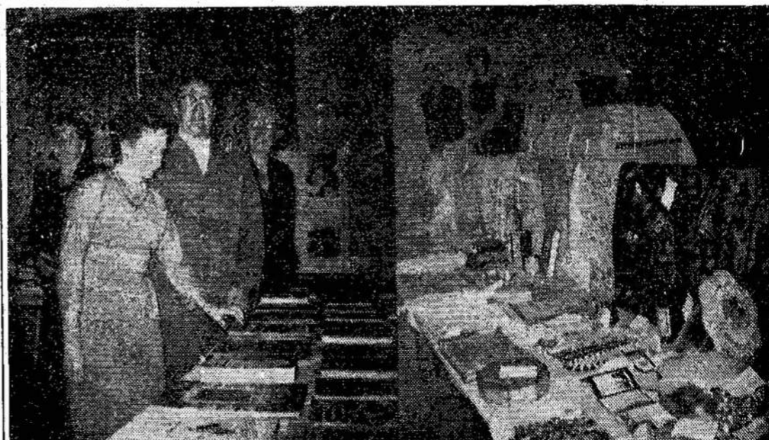
Neseniai Toronto Lietuvių Moterų Klubas buvo suruošęs parodą Lietuvos leidžiamų knygų, rankdarbių ir kitų Lietuvos gautų dalykų.

Girdi, jeigu liberalai būtų išrinkti, tai jie iširtų kartu su provincijomis galimybę įvedimo tokios sveikatos apdraudos, kuri apimtų medikales, dantų ir operacijų išlaidas.