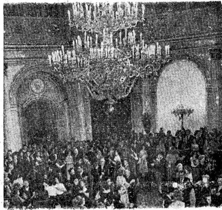
Maskvos jaunimas linksminasi Kremiaus rūmuose, Vladimiro salėj. Viskas, į-

"Tai ne tiesa. Bile kas, bent kiek susipažinęs su rusų planais dėl šalies rytojaus — kaip kad apšvieta 50 milijonų vaikų, pamint tikrai vieną dalyką — matyt, kad Rusija, tiek pat kaip ir Jungtinės Valstijos, gali