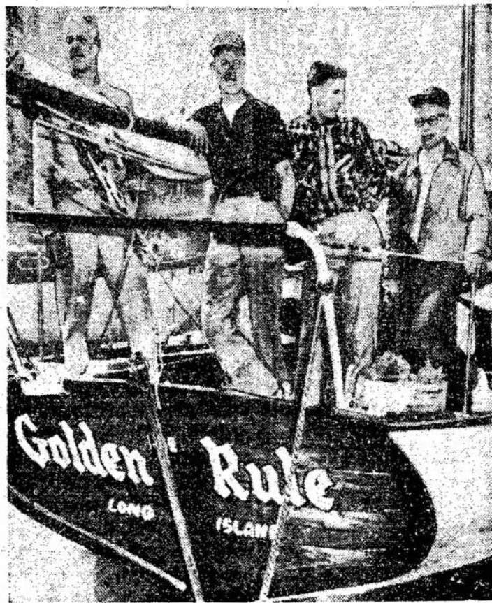
Laivas Golden Rule, kuriuo linkę Pacifike. Tai bus antmi keturi nuklinių bandymų oponentai ruošiasi vykty JAV nuklinių bandymų apy-

linkę Pacifike. Tai bus antmi keturi nuklinių bandymų oponentai ruošiasi vykty JAV nuklinių bandymų apy-