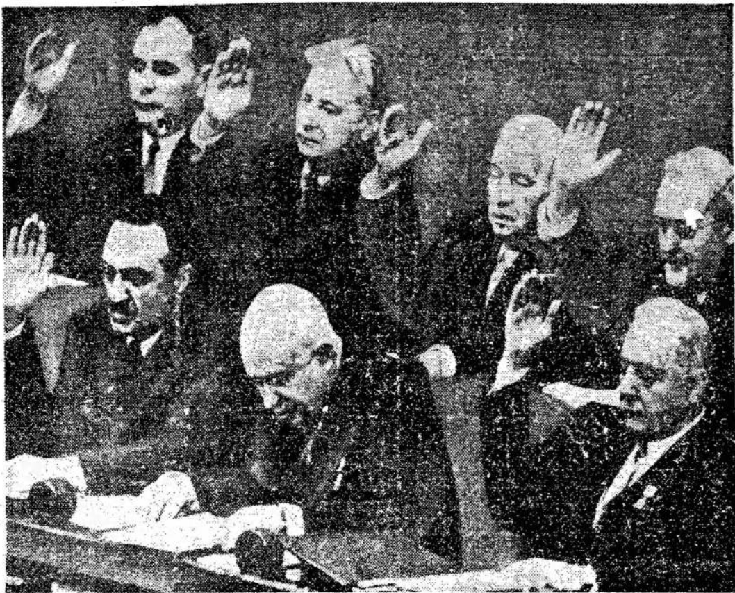
Tarybų Sąjungos lyderiai Aukščiausios Tarybos posėdyje balsuoja renkant premjerą. Kaip žinia, juomi išrinktas N. Chruščiovas. N. Bulganinas taipgi matomas balsuojant už Chruščiovą. Toj pačioj sesijoje buvo paskelbta, kad TSRS nutraukia nuklinius bandymus. Tarybų Sąjungą ragina ir kitus pasekti ją.