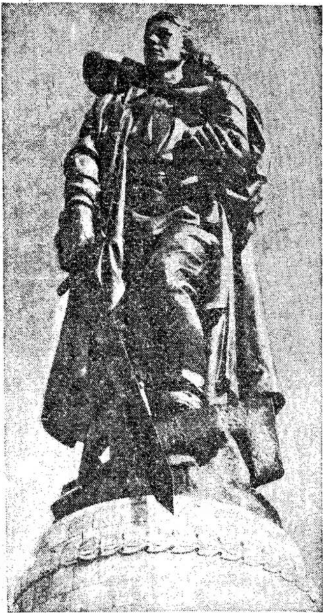
Paminklas tarybiniams kariams, kritusiems užimant Berlyną.

Iš bendradarbiavimo su Lietuva, pasak Tautvilos, būtų nemaža naudos visiems lietuviams išsivijoje. Pavyzdžiui: