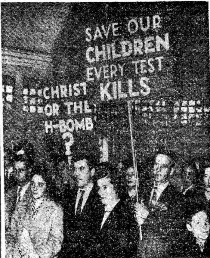
Aną sekmadienį Toronte buvo suruošta demonstracija prieš nuklinius bandymus. Dalyvavo keli šimtai žmonių. Šioj nuotraukoj matote dalį demonstracijos su plakatais.