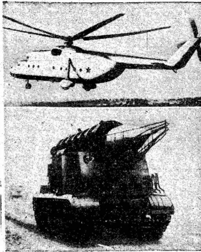
Tarybinės armijos ginklai. Apačioj, raketinė artilerija. Viršuj, helikopteris, varomas dviejų gaziųjų turbinų. Šios artilerijos raketos gali pasiekti priešą už 50 mylių.

Jeigu nesusitiksime piknike, tai paskui bus maža pro-