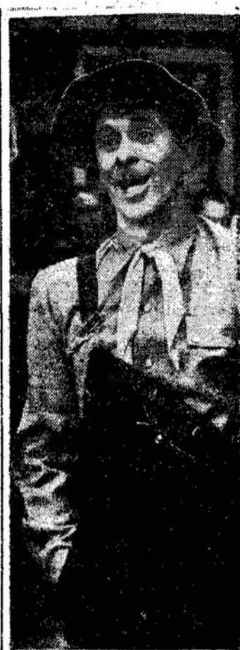
Gordie Tapp, CBC Televizijos Country Hoedown programos žvaigždė.

lijoje į savo pagrindus deda tuos pačius "veiksnius" propaguojamus dalykus. Jiems bendruomenė yra tik įrankis — biznis. Bus pinigų. Jie naudos juos sau ir savo veiklai.