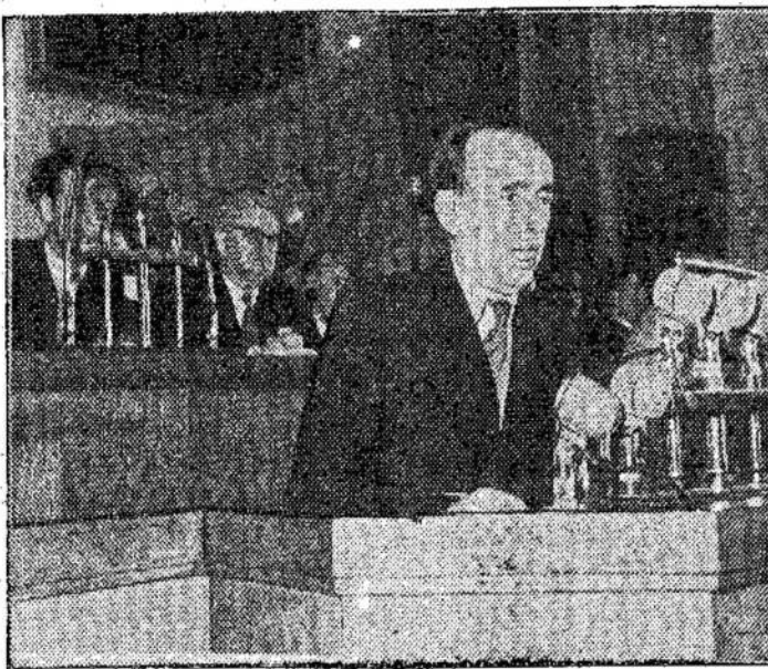
Tarybų Lietuvos rašytojų III suvažiavimo tribūnoje — poetas Antanas Miškinis.