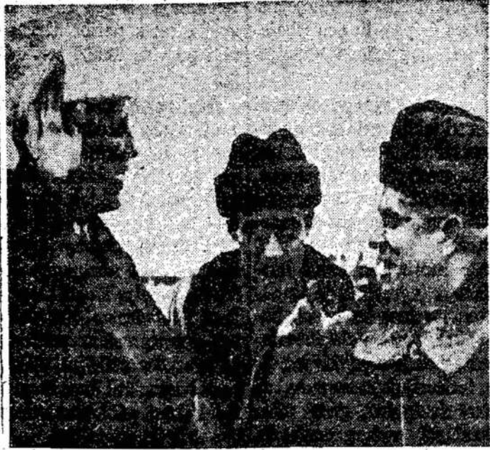
Britanijos premjeras H. Macmillan ir Tarybų Sąjungos premjeras N. Chruščiovas susitinka Vnukovo aerodrome pirmajam pribuvus iš Britanijos.