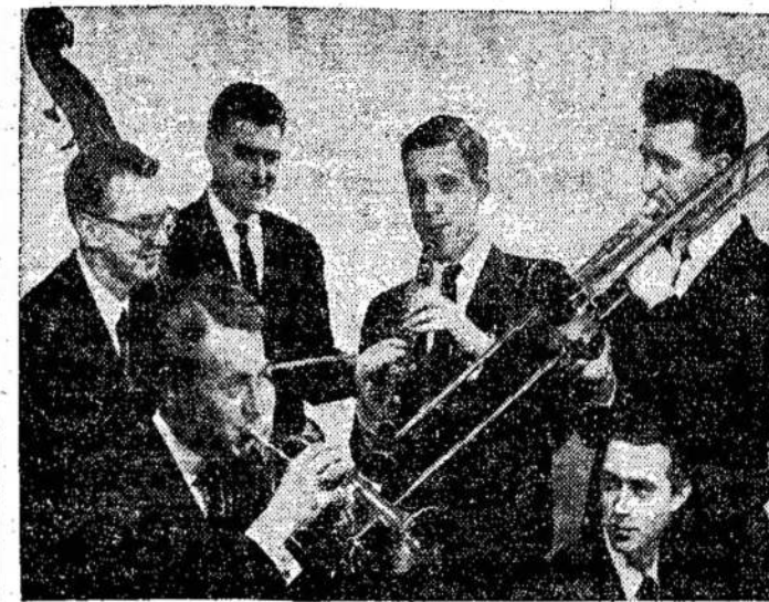
CBC džiaz muzikantai. Juos programoj. Jie groja kas va galima ir ant televizijos pamatyti "Music Makers '59" bučių.

Jau 12 metų, kaip buvo pradėta pradinių mokyklų mergaites mokinti baletu.