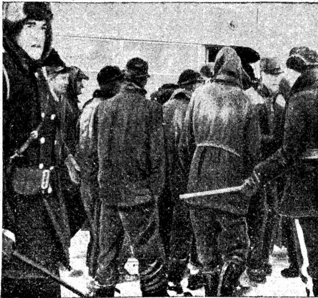
Policija muša lazdomis Newfoundlando miško darbininkus, streikuojančius už žmoniškėnes darbo sąlygas. Jie verčiami dirbti 60 valandų į savaitę, kai kitur dirba po 40 valandų ir mažiau. Prie vietinės policijos buvo pašaukta dar apie 100 RCMP.