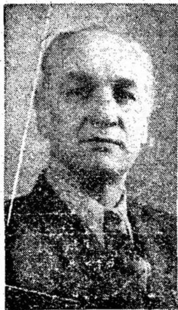
Justas Paleckis LTSR Aukščiausiosios Tary- bos Prezidiumo Pirmininkas