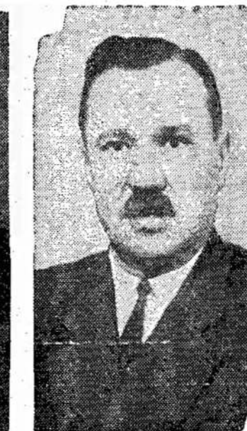
Antanas Sniečkus LTSR Aukščiausiosios Tary- bos Prezidiumo narys