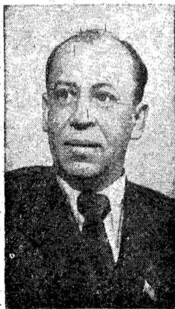
Vladas Niunka LTSR Aukščiausiosios Tarybos Pirmininkas