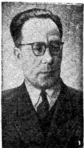
Kostas Korsakas LTSR Aukščiausiosios Tarybos Pirmininko pavaduotojas