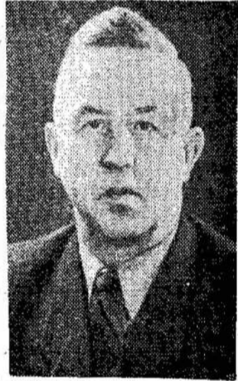
Ksaveras Kairys Lietuvos TSR Liaudies ūkio tarybos Pirmininkas