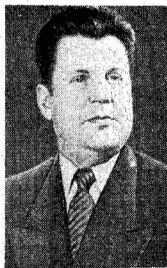
Kazys Preikšas Lietuvos TSR Ministrų Tarybos Pirmininko pavaduotojas — LTSR Užsienio reikalų ministras