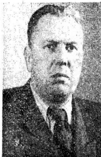
Motiejus Šumauskas Lietuvos TSR Ministrų Tarybos Pirmininkas