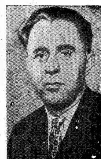
Romualdas Sikorskis Lietuvos TSR Finansų ministras (Bus daugiau)