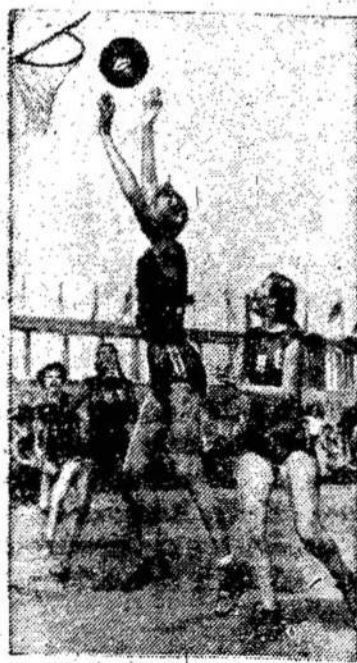
Telių ir Kalvarijos krepšinininkės žaidžia Vilniuje Lietuvos spartakiados metu.

Liepos 28 dienos rytą palisėję svečiai pradėjo judėti "Vilniaus" viešbučio koridoriuose, pusryčiaavo ten pat viešbučio restorane, atskiriamis grupėmis ėmė vaikščioti po miestą, o greit atvyku-