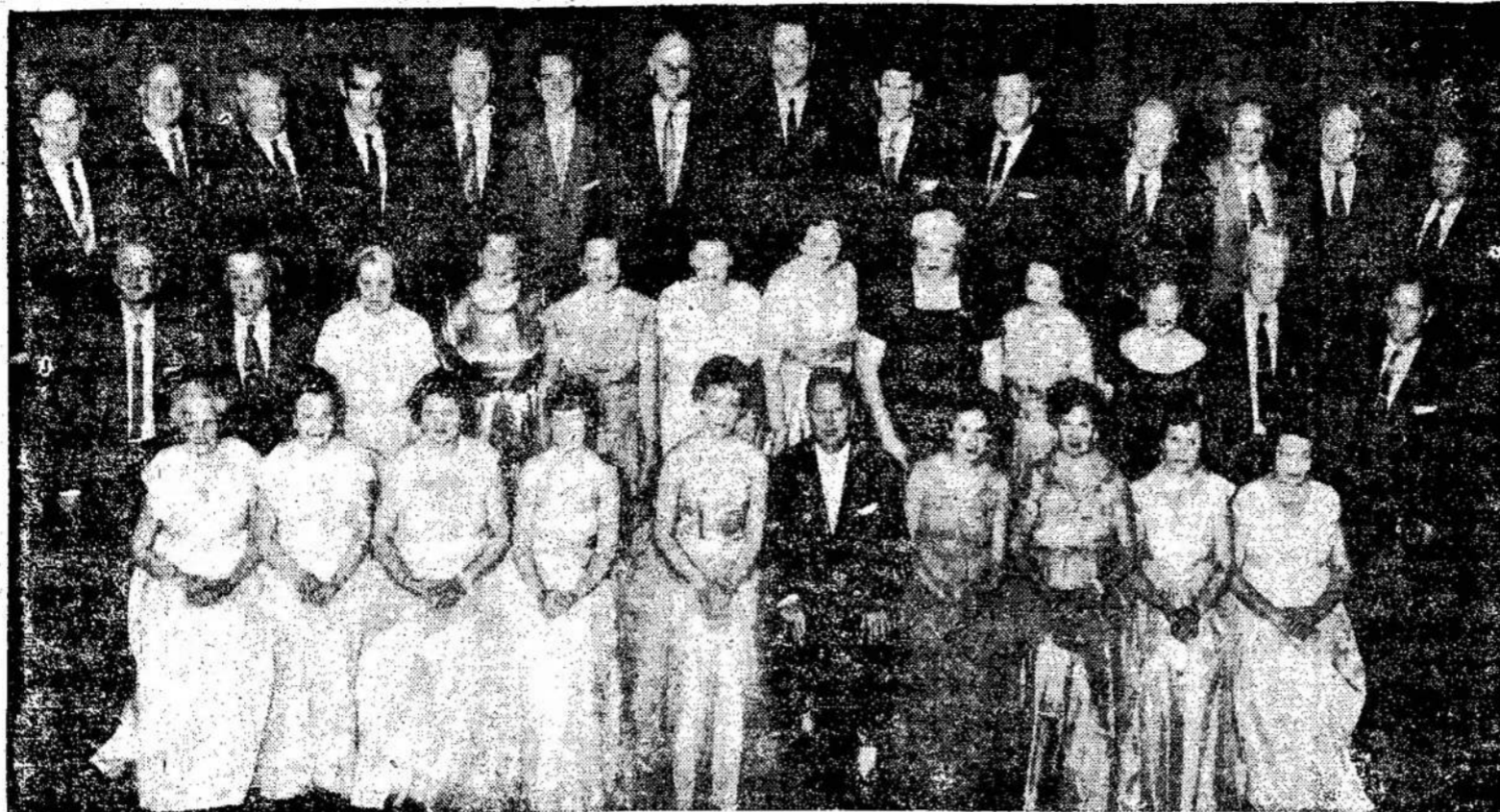
Roselando choras, kurs lapkričio (Nov.) 22 dieną pastatys Detroito operą "Zaporožietis už Dunojaus". Detroitiečiai tikisi turėti daug svečių ir iš Kanados. O amerikiečiai, be abejo, suvažiuos iš daugelio vietų.